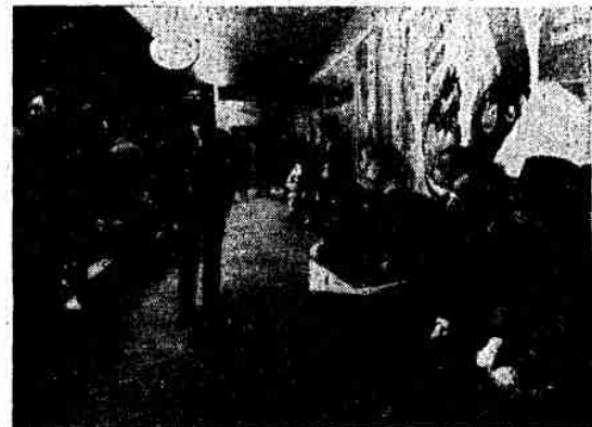
Warten auf den ersten Zug: Straßenbahnfahrt unter der Erde ist Attraktion

Mariahilfer Straße — wenn man von der einen fehlenden Rolltreppe, für die die Gemeinde nichts kann, absteigt. Im oberen Stockwerk liegt die Fußgängerpassage mit Schauvitrinen und Geschäften. Sogar ein Kino gibt es hier und eine Kunstausstellung. In einer Buchhandlung werden täglich nach Geschäftsschluss bis zu nächst 22 Uhr junge Künstler die Möglichkeit erhalten, ihre Arbeiten zu zeigen. Der erste ist der Linzer Anton Watzl mit sehenswerten Graphiken.