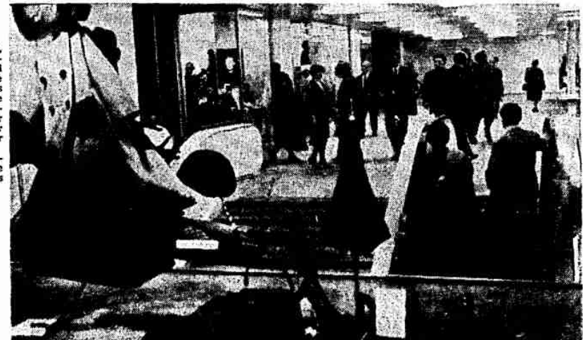
Mariahilfer Passage: Ungefährdet von einer Straßenseite zur anderen kommen, einkaufen und Auslagen anschauen

Wer nach dem Rundgang durch diese neue große Passage wieder an die Oberfläche kommt, wird in den Verkehrsalltag zurückgerufen: Die Kreuzung Mariahilferstraße-Lastenstraße ist zwar für den Autoverkehr frei, doch sie ist noch Baustelle. Es wird noch bis zum Frühjahr dauern, bis die Autofahrer die Lastenstraße nicht mehr mit den Fußgängern zu teilen brauchen.