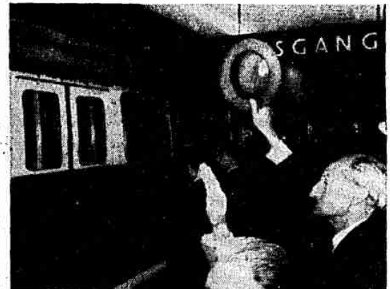
Applaus und Hüteschwenken: Abschied von der Oberfläche für 2 Kilometer

Vorläufig werden zwar noch Tramwaygarnituren die neue unterirdische Teilstrecke befahren. Aber dieses